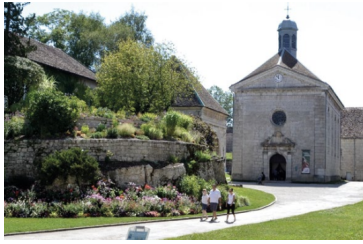
Figure 2: Chapelle Saint Etienne, Citadelle de Besançon